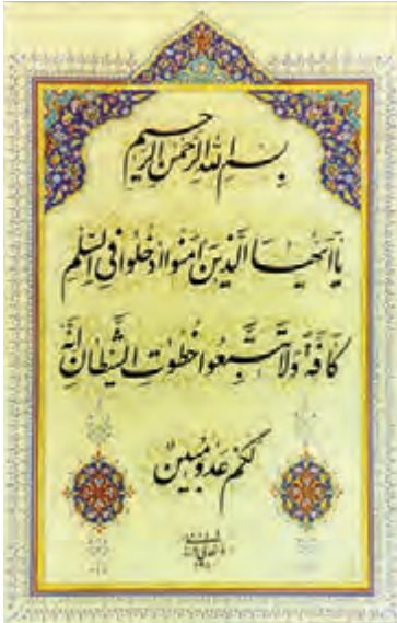
سوره بقره آیه ۲۰۸

هر فردی که قرآن کریم را بخواند و بتواند کلمات قرآن را برای خود ترجمه کند، معانی آیات را متوجه می‌شود، ولی بعضی از آیات را افراد متخصص در قرآن باید توضیح بیشتری بدهند تا ابعاد مختلف آن بیشتر معلوم شود. به کتاب‌هایی که آیات قرآن را ترجمه کرده و درباره آن توضیحات بیشتری مانند، دلائل نزول آن آیه یا سوره، زمان نزول و معانی و مقصود آیات با توجه به سایر آیات و سخنان پیشوایان دین آورده‌اند، کتاب تفسیر قرآن گفته می‌شود. در جهان اسلام تاکنون برای قرآن حدود پانصد تفسیر نوشته شده است که برخی از آن تفاسیر به بیست‌الی سی جلد می‌رسد. یکی از تفاسیر بسیار خوب، تفسیر نمونه نام دارد که با همکاری جمعی از دانشمندان و زیر نظر آیت‌الله مکارم شیرازی در ۲۷ جلد تألیف شده است.